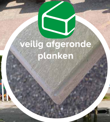
veilig afgeronde planken