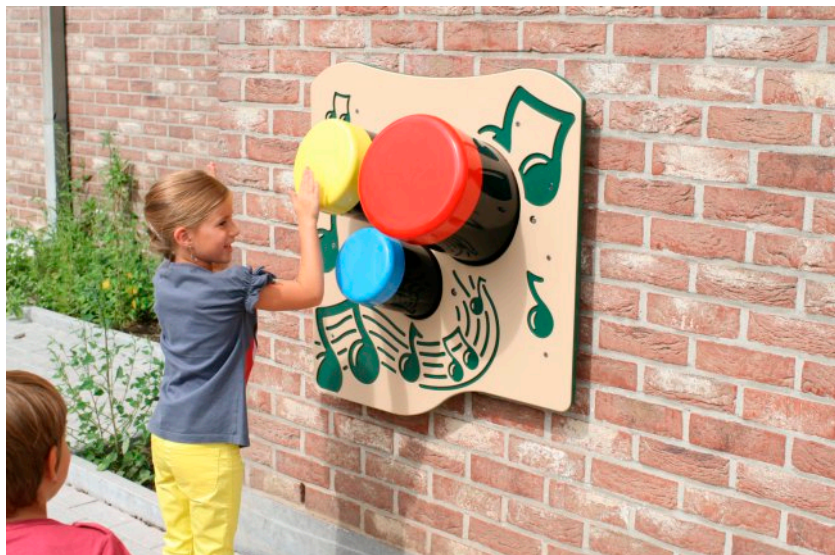
standaard deze kleurstelling

Ontworpen naar de Europese norm EN 1176, maar valt daar eigenlijk niet echt onder. Vandaar is het product niet standaard voorzien van een typeplaatje.