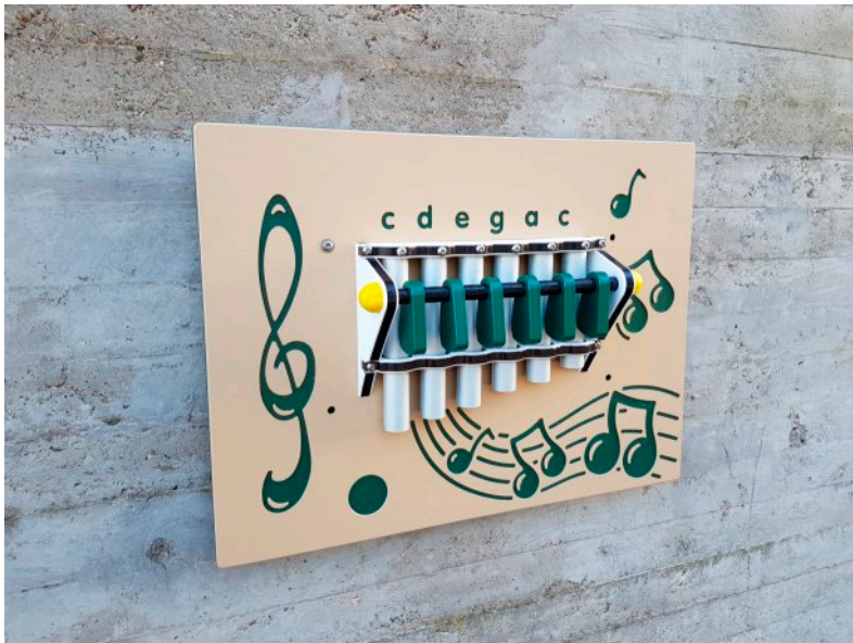
standaard deze kleurstelling

Ontworpen naar de Europese norm EN 1176, maar valt daar eigenlijk niet echt onder. Vandaar is het product niet standaard voorzien van een typeplaatje.