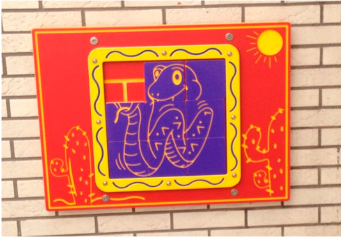
standaard deze kleurstelling