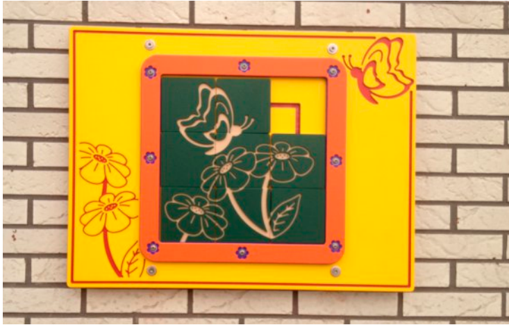
standaard deze kleurstelling