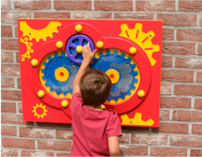
standaard deze kleurstelling, zonder tekst