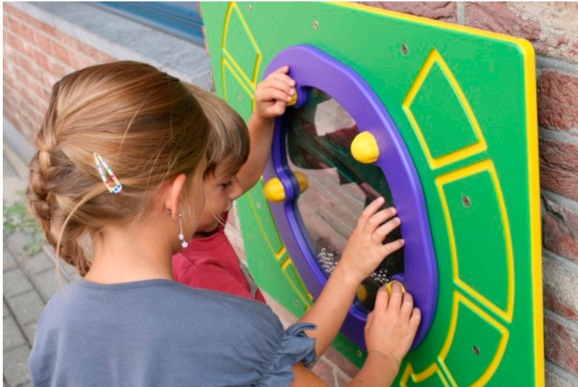
standaard deze kleurstelling