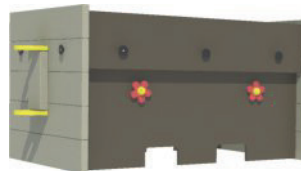
GP36B5 75 cm hoog +/- 133 kg